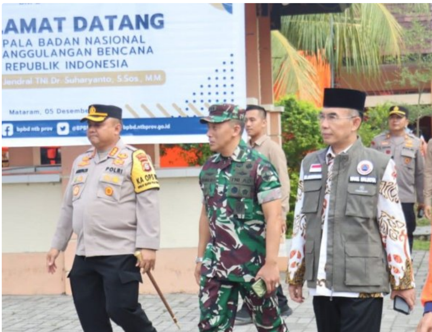
Kapolresta Mataram (Kiri) saat menghadiri acara Peletakan batu Pertama pembangunan gedung Pusdalops BPBD NTB, Kamis (05/12/2024)